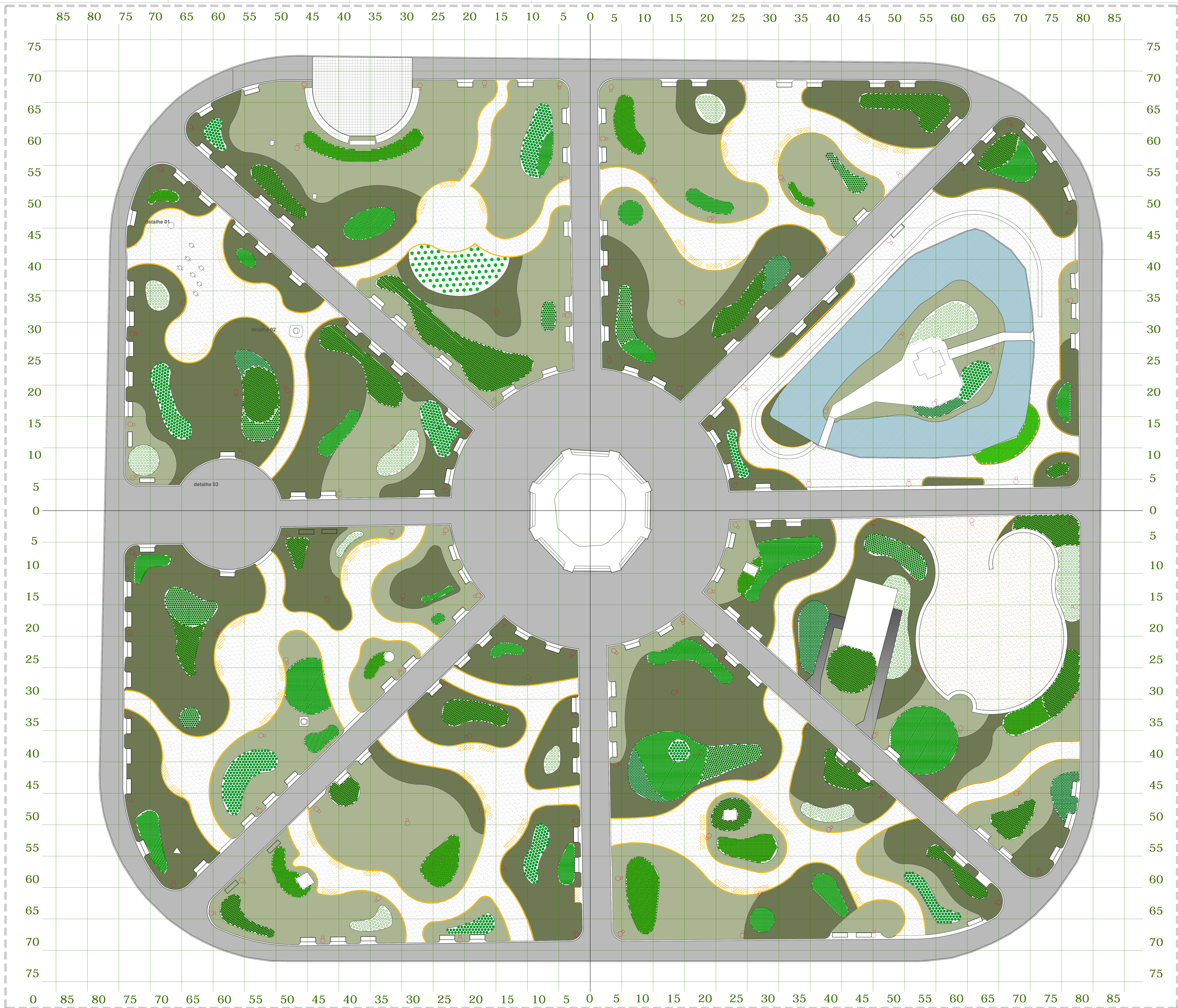
praça cel. pedro osório_planta geral das formações esc.: 1 | 100